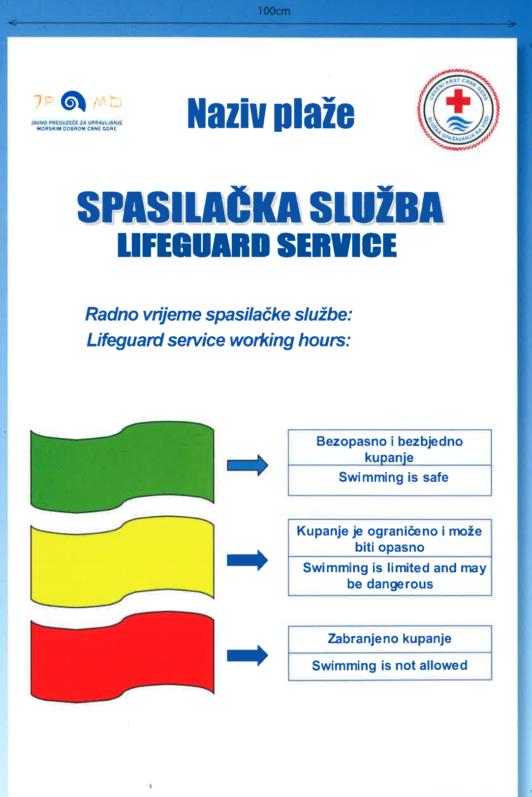
skica br. 4